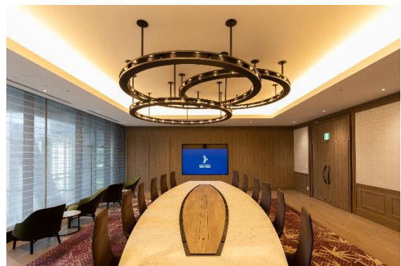
【4階 Board Room】

福岡市では今夏、世界水泳選手権 2023 福岡大会が開催されます。さらに大型国際会議の誘致に乗り出すなど、コロナ禍からの回復を見据え、福岡市はビジネスインバウンドに積極的に取り組んでいます。