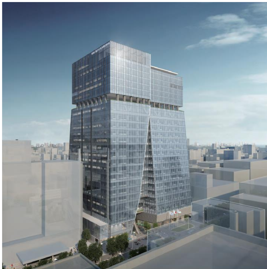
明治通り東側からの全景 イメージ画像

福岡市の中心部、大名小学校跡地に、地上 25 階、地下 1 階のオフィス・ホテル棟、公民館・保育施設・創業支援施設などが入る地上 11 階のコミュニティ棟、緑溢れる約 3,000 ㎡の広場などで構成される、敷地面積約 10,000 ㎡の複合施設です。オフィス・ホテル棟にはカンファレンス施設の他、ザ・リッツ・カールトン福岡、商業施設などが入ります。