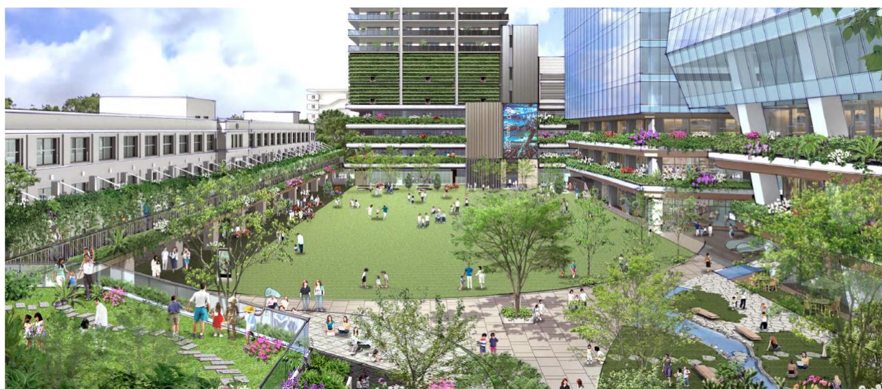
広場東側からコミュニティ棟を望む イメージ画像