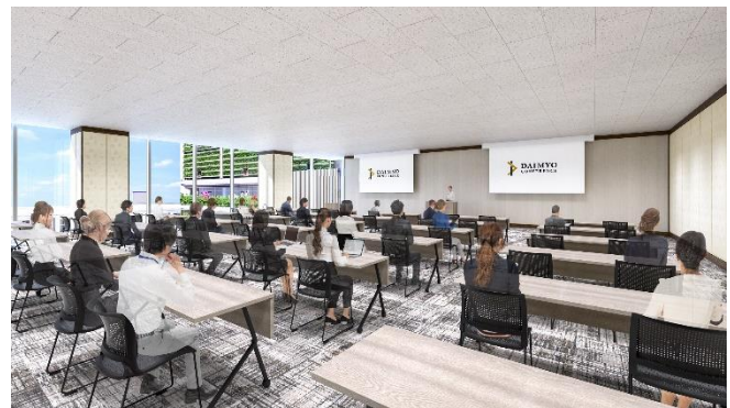
【4階 Link Room1 イメージ画像】

当社は、「DAIMYO CONFERENCE」が、アジアの玄関口・福岡のビジネス発信拠点になることを目指すとともに、MICE *2 運営における豊富な経験・実績を活用し、「福岡大名ガーデンシティ」一帯へのMICE誘致促進、賑わいづくりに貢献してまいります。