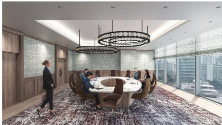
4階 Board Room イメージ画像